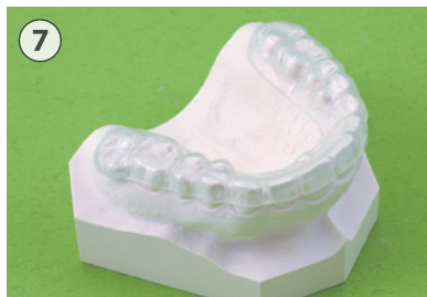
⑦ ソフトリテーナー