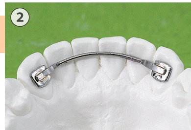
② ボンディングリテーナー