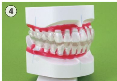
④ ダイナミックポジショナー