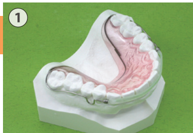
① リテーナー(QCMタイプ)