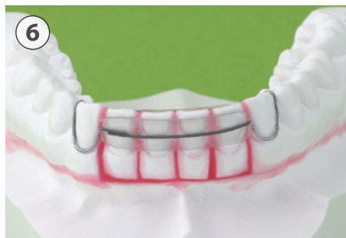
⑥ スプリングリテーナー