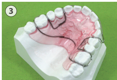
③ リテーナー(ホーレータイプ)