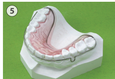
⑤ リテーナー(ベッグタイプ)